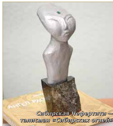
Сибирская Неферити — талисман «Сибирских огней»

ности, есть то, что не видно публике. Это та атмосфера, в которой происходит созревание души. И как только возникает иллюзия признания, ты становишься человеком публичным и уже себе не принадлежишь. Это огромное искушение. Однако писатель — профессия сокровенная. Конечно, нам бы хотелось, чтобы наш труд был оценен и оплачен, возможно, не так достойно, как в прежние времена, но хотя бы был вписан в социальный контекст. Ибо статус литератора сейчас сродни статусу бомжа. Литератур-