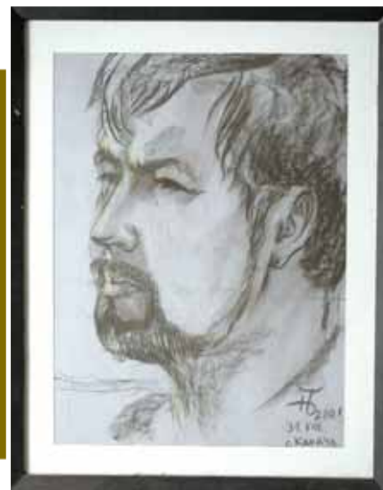
Таким видят Мастера друзья-художники

— Но мне кажется, что те миры, которые создает писатель, существуют в современной действительности в отрыве от нее?